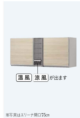
※写真はエリーナ開口75cm

※エリーナにはオプションでソフトクローズ仕様、耐震ラッチをご用意しています。 ※ファミーユにはオプションで耐震ラッチをご用意しています。