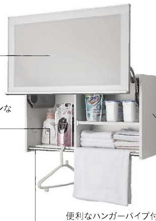
便利なハンガーパイプ付

ランドリーウォールキャビネット(開口75cm) S-XJUW075XCX(XAV)S/B (750×325×450mm) ¥70,000